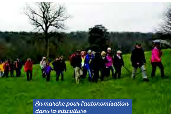
En marche pour l'autonomisation dans la viticulture

Cette action favorise l'autonomie de deux femmes en recherche d'emploi.